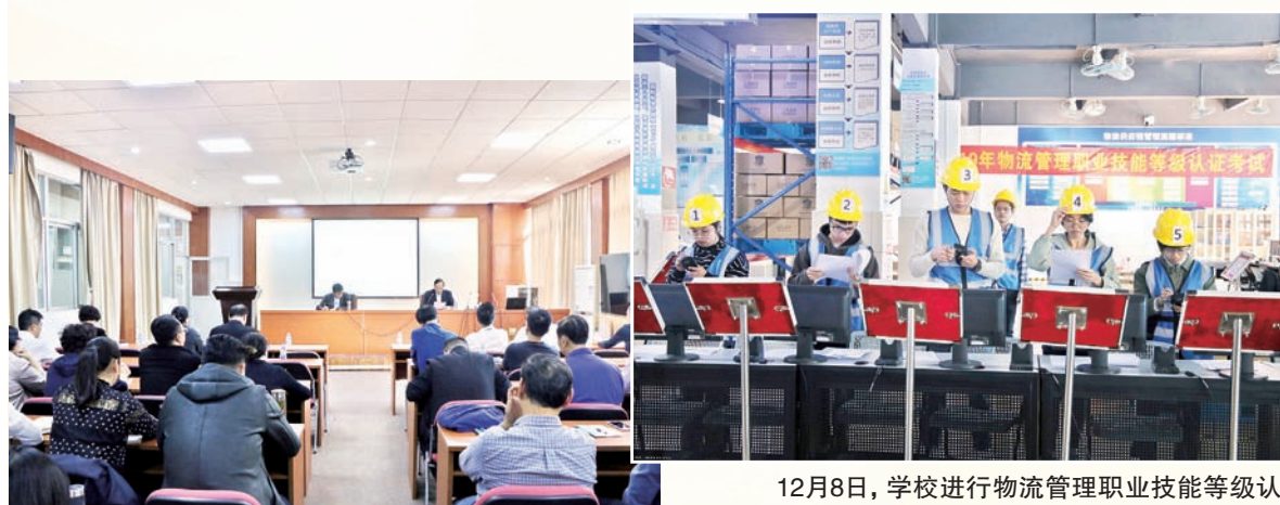
5月29日，学校召开中层干部会议，校长和飞部署本科试点工作