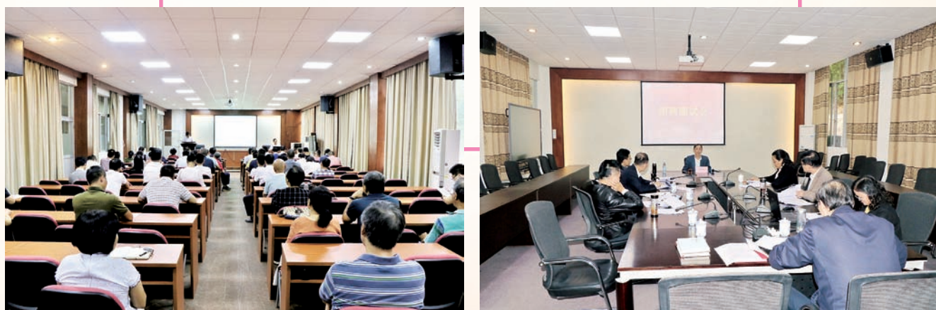
11月20日，学校召开中高层干部扩大会议，落实和推进“三定方案”