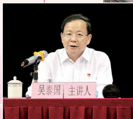
10月11日，吴泰国书记莅临我校举办专题报告会