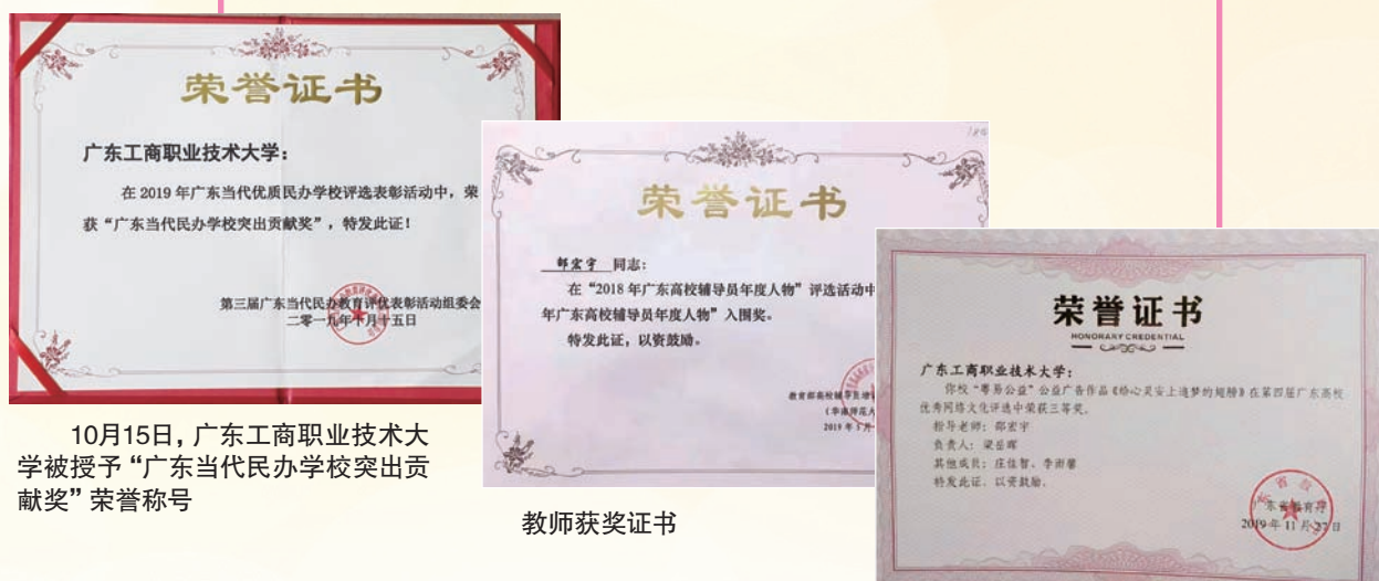
10月15日，广东工商职业技术大学被授予“广东当代民办学校突出贡献奖”荣誉称号