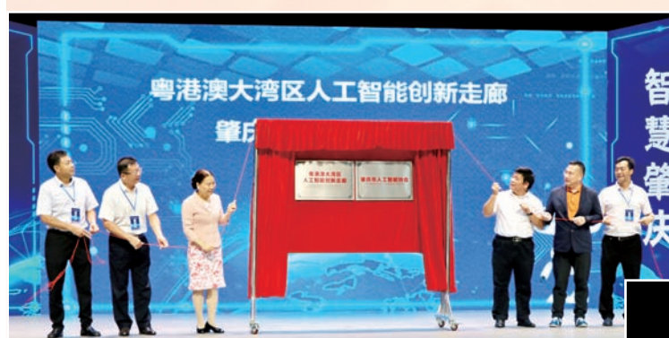
7月1日，肇庆市人工智能协会和大湾区AI创新走廊揭牌仪式