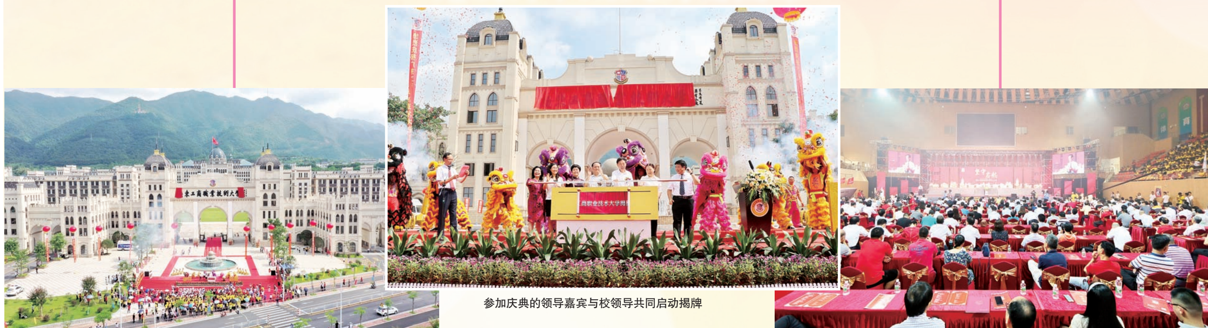
参加庆典的领导嘉宾与校领导共同启动揭牌